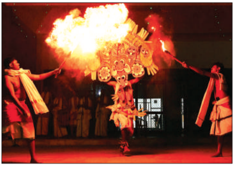
केरल के भद्रकाली कोट्टायम लोक नृत्य की प्रस्तुति देते कलाकार।

मानव संग्रहालय में स्थापना दिवस समारोह के तीसरे और अंतिम दिन पारंपरिक खिलौने (काष्ठ कला) का आकर्षक प्रदर्शन किया गया। साथ ही रंगारंग सांस्कृतिक गतिविधियों की शुरुआत केरल के पारंपरिक भैरवी कोलम नृत्य से हुई, जिसमें रंगों, लय और भाव-भंगिमाओं के माध्यम से आध्यात्मिक एवं सांस्कृतिक अभिव्यक्ति का सुंदर समन्वय देखने को मिला।