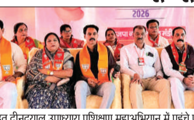
पंडित दीनदयाल उपाध्याय प्रशिक्षण महाअभियान में पहुंचे पदाधिकारी।

संगठन अजेय बनता है और जब संगठन अजेय होता है, तब राष्ट्र प्रगति के शिखर पर पहुंचता है। उन्होंने पंडित दीनदयाल उपाध्याय के एकात्म मानववाद और अंत्योदय के सिद्धांतों को संगठन की आत्मा बताते हुए कहा कि भाजपा की राजनीति केवल सत्ता प्राप्ति का माध्यम नहीं, बल्कि सेवा, समर्पण और राष्ट्र निर्माण का संकल्प है।