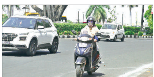
राजधानी का कमला पार्क, दोपहर 1:44 बजे का दृश्य