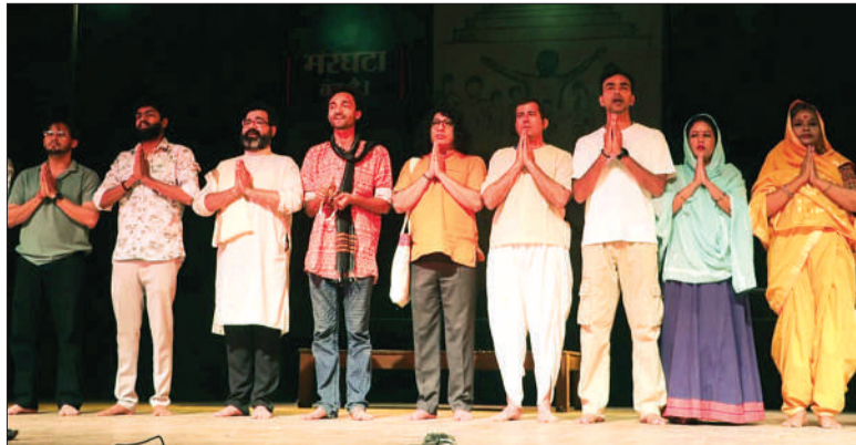
रवींद्र भवन में नाटक ‘रंग जोगी बाबा अलख बनाम महानिर्वाण’ का मंचन करते कलाकार।