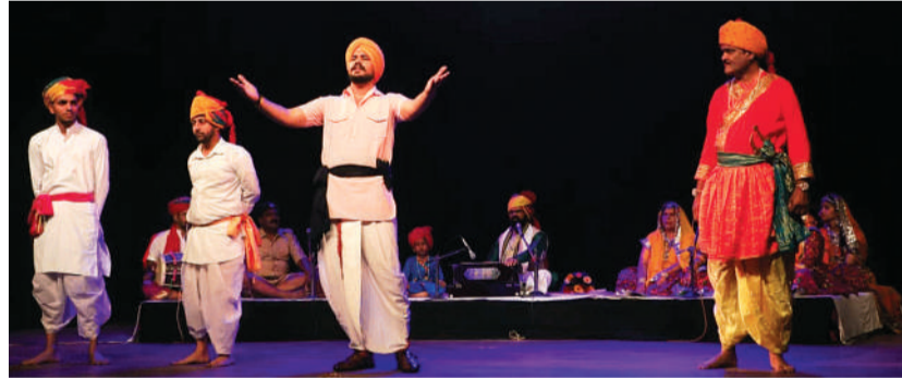
शहीद भवन सभागार में नाटक शहीद भगत सिंह का मंचन करते कलाकार।