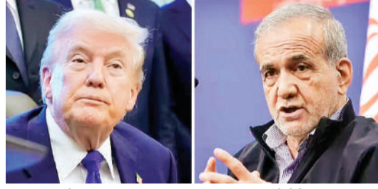
डोनाल्ड ट्रंप मसूद पेजेशिकयान

ईरान बोला हमारे सख्त रुख के बाद अमेरिका को पीछे हटना पड़ा