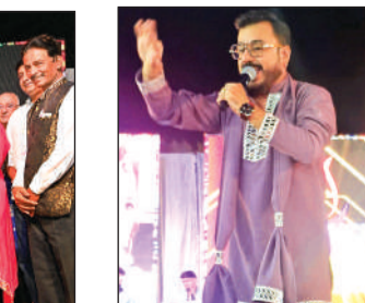
सांस्कृतिक संस्था में गीतों की प्रस्तुति देते कलाकार।