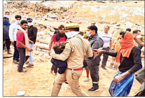
हादसे के बाद घायल को पुलिसकर्मी ले जाते हुए