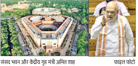
संसद भवन और केंद्रीय गृह मंत्री अमित शाह फाइल फोटो

816 होंगे लोकसभा सांसद 273 सीटें महिलाओं के लिए