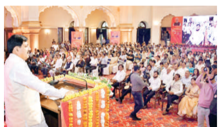
सीएम यूपीएससी में चयनित लोगों से बात करते हुए

आपका चयन स्थायी, हमें तो हर पांच साल में देनी पड़ती है परीक्षा