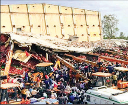
कोल्ड स्टोरेज में घायलों का रेस्क्यू ऑपरेशन