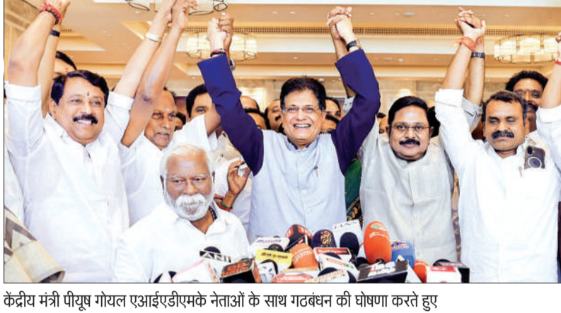
केंद्रीय मंत्री पीयूष गौयल एआईएडीएमके नेताओं के साथ गठबंधन की घोषणा करते हुए

भाजपा सहयोगी दल के बजाए मुख्य खिलाड़ी की भूमिका में