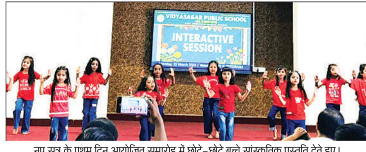
नए सत्र के प्रथम दिन आयोजित समारोह में छोटे-छोटे बच्चे सांस्कृतिक प्रस्तुति देते हुए।