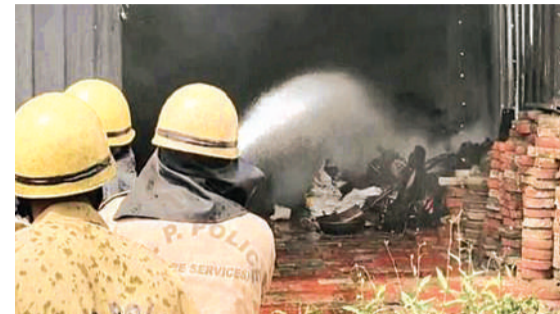
गैरेज में भीषण आग को बुझाती फायर ब्रिगेड की टीम

चोइथराम अस्पताल के नजदीक स्थित लेकपार्क कॉलोनी में सोमवार सुबह उस वक्त अफरा-तफरी मच गई जब यहां स्थित एक गैरेज में अचानक भीषण आग लग गई। राजेंद्र नगर थाना पुलिस और फायर ब्रिगेड की टीम तत्काल मौके पर पहुंची और राहत कार्य शुरू किया गया। जिस गैरेज में यह अग्निहादसा हुआ वहां 6 कारें खड़ी थीं। आग की चपेट में आने के कारण ये 6 कारें