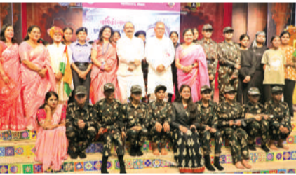
मंत्री इन्द्र सिंह परमार सरोजिनी नायडू शासकीय कन्या स्नातकोत्तर स्वशासी (नूतन) महाविद्यालय के वार्षिकोत्सव एवं पुरस्कार वितरण समारोह में शामिल हुए।

स्वयं प्रभा 2026 का शुभारम्भ करते हुए उच्च शिक्षा, तकनीकी शिक्षा एवं आयुष मंत्री इन्द्र सिंह परमार ने कहा कि हर संस्थान में विद्यार्थियों के वर्ष भर की गतिविधियों एवं उपलब्धियों के सार्वजनिक प्रकटीकरण का सशक्त मंच है और महाविद्यालय की प्रतिष्ठा के प्रदर्शन का भी यह सुअवसर है। उन्होंने कहा कि सार्थक एप के माध्यम से, प्राध्यापकों की संस्थान में अधिकतम उपस्थिति सुनिश्चित की जा रही है। इस अनुक्रम में विद्यार्थियों की संस्थान परिसर में अधिकतम उपस्थिति सुनिश्चित करने के लिए, अगले सत्र से, सार्थक एप के माध्यम से उपस्थिति सुनिश्चित की जाएगी और विद्यार्थियों को अधिकतम उपस्थिति पर क्रेडिट भी दिया जाएगा।