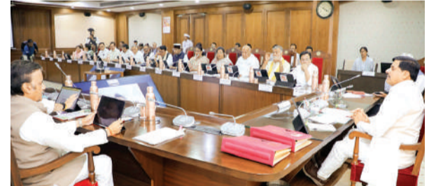
सीएम डॉ. यादव मंत्रियों के साथ कैबिनेट की बैठक लेते हुए

सरकार पूरक पोषण आहार पर हर दिन करीब सवा करोड़ रुपए से अधिक की राशि खर्च करेगी