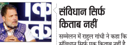
एजेसी नई दिल्ली राहुल गांधी

संविधान सिर्फ किताब नहीं है, बल्कि यह देश को सोच और हर नागरिक के अधिकारों की गारंटी है, जिसमें हजारों साल पुराने विचार शामिल हैं। उन्होंने आरोप लगाया कि पीएम नरेंद्र मोदी समेत भाजपा के नेता एक तरफ महान मूर्तियों के सामने सम्मान दिखाते हैं, लेकिन दूसरी तरफ आदिवासियों के अधिकारों को कमजोर करते हैं। उन्होंने इस बात पर भी जोर दिया कि आदिवासियों को वनवासियों कहना उनकी पहचान पर हमला है। उन्होंने आरोप लगाया कि उनकी जमीन, जल और जंगल छीनकर कॉर्पोरेट्स को दिए जा रहे हैं, जो संविधान और बिरसा मुंडा के आदर्शों के खिलाफ है। राहुल गांधी ने अमेरिका के साथ हुए व्यापार समझौते को लेकर कहा कि पहली बार भारत का कृषि क्षेत्र अमेरिकी उत्पादों के लिए खोल दिया गया है। राहुल गांधी ने आरोप लगाया कि इस फेसले से देश के किसानों पर असर पड़ सकता है।