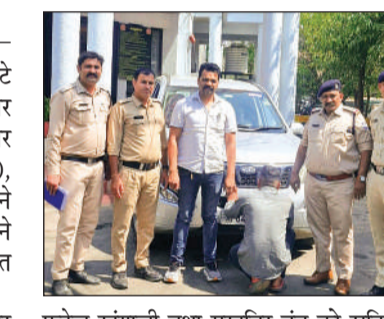
फुटेज खंगाली तथा मुखबिर तंत्र को सक्रिय किया। 22 मार्च को सूचना मिली कि एक युवक मानसरोवर कॉम्प्लेक्स के आसपास दुकानदारों से एक्सयूवी-500 कार बेचने की बात कर रहा है।

हबीबगंज पुलिस ने तत्परता दिखाते हुए 12 घंटे के भीतर चोरी की गई एक्सयूवी-500 कार बरामद कर एक शातिर वाहन चोर को गिरफ्तार किया है।