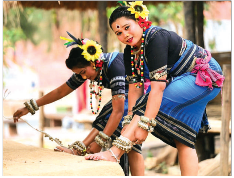
मानव संग्रहालय में स्थापना दिवस समारोह के अंतिम दिन सांस्कृतिक नृत्य की तैयारी करती कलाकार।

इसके पश्चात ओडिशा का लोकप्रिय लोकनृत्य छुटकु छुटा प्रस्तुत किया गया। इस नृत्य में ग्रामीण जीवन की सादगी, उल्लास और सामूहिकता की भावना को जीवंत रूप में प्रदर्शित किया गया। वहीं तमिलनाडु के कलाकारों द्वारा प्रस्तुत पुलियाट्टम, मायलाट्टम एवं मारट्टम ने कार्यक्रम में विशेष रंग भर दिया। पुलियाट्टम (बाघ नृत्य) में कलाकारों ने बाघ के रूप में सजकर साहस और शक्ति का प्रदर्शन किया, वहीं मायलाट्टम (मोर नृत्य) में सौंदर्य और लय का अद्भुत संयोजन देखने को मिला।